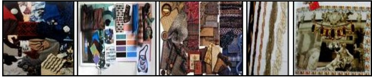
صورة (17) لوحات الخامات Mood Materials للأزياء بالمووضة العالمية