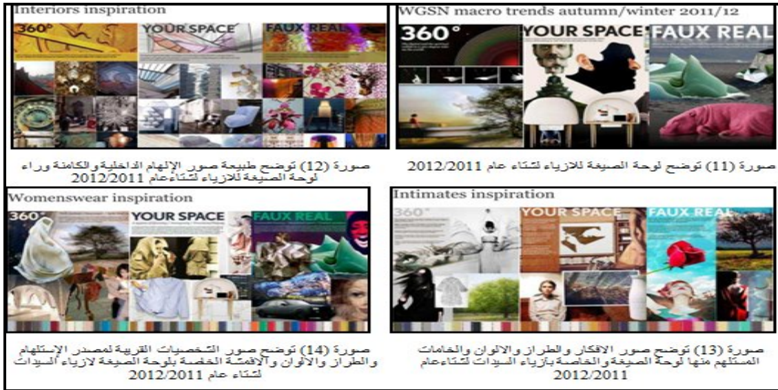
صورة (12) توضح طبيعة صور الإلهام الداخلية والكامنة وراء لوحة الصبغة للأزياء لشتاء عام 2011/2012