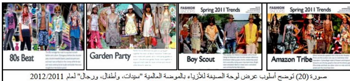
صورة (20) توضح أسلوب عرض لوحة الصيغة للأزياء بالموضة العالمية "سيدات، وأطفال، ورجال" لعام 2011/2012