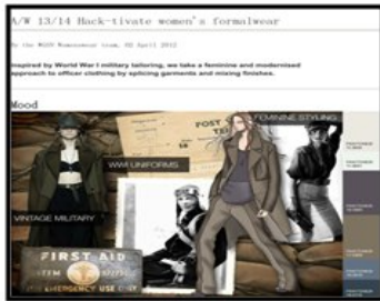
صورة (3) لوحة الطراز Style

- لوحة المفهوم:- هي الصفحة أو اللوحة لمجموعة الصفات