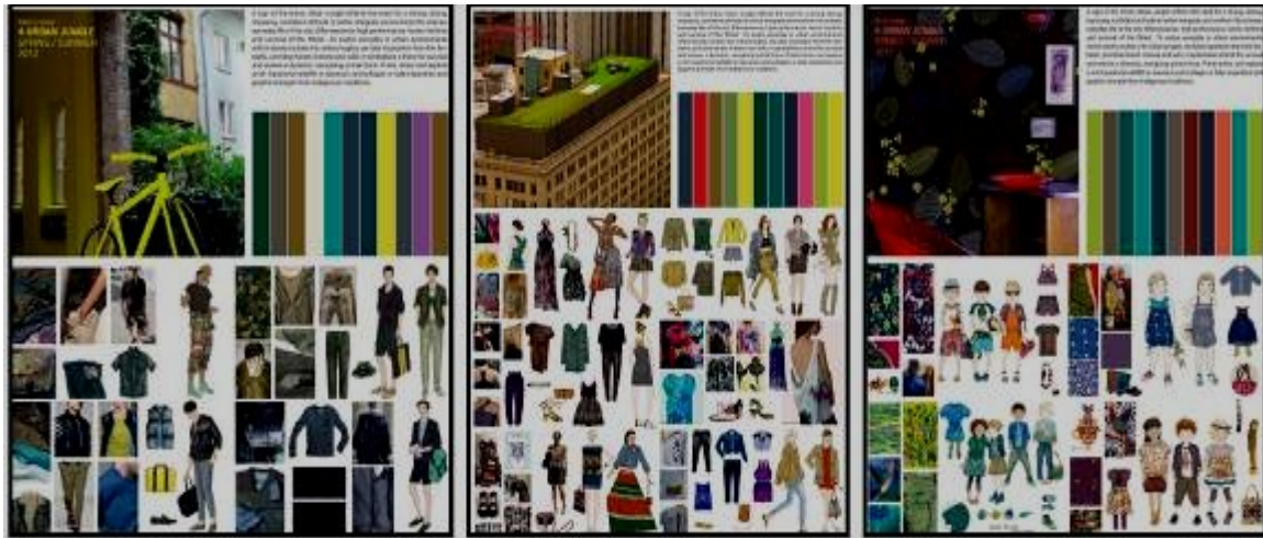
صورة (19) توضح أسلوب عرض لوحة الصيغة للأزياء بالموضة العالمية "سيدات، وأطفال، ورجال" لعام 2011/2012