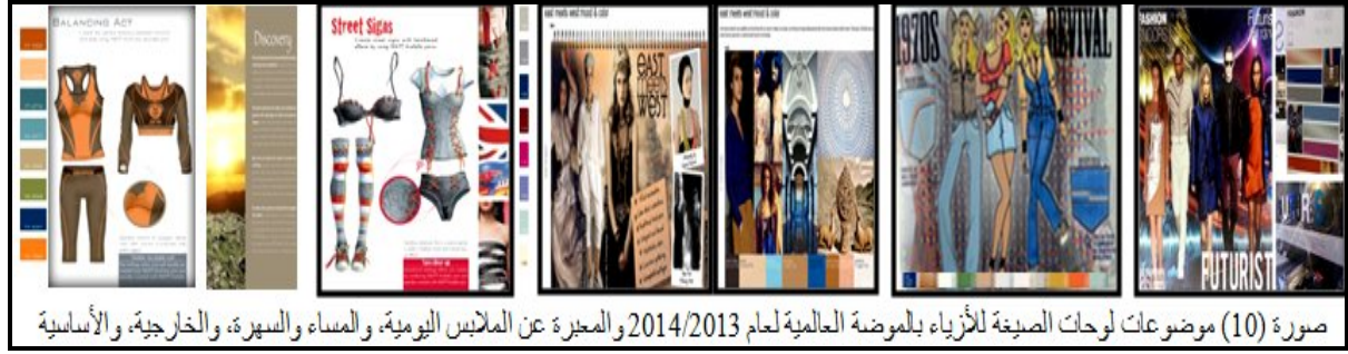
صورة (10) موضوعات لوحات الصبغة للأزياء بالموضة العالمية لعام 2013/2014 والمغبرة عن الملابس اليومية، والمساء والسهرة، والخارجية، والأساسية