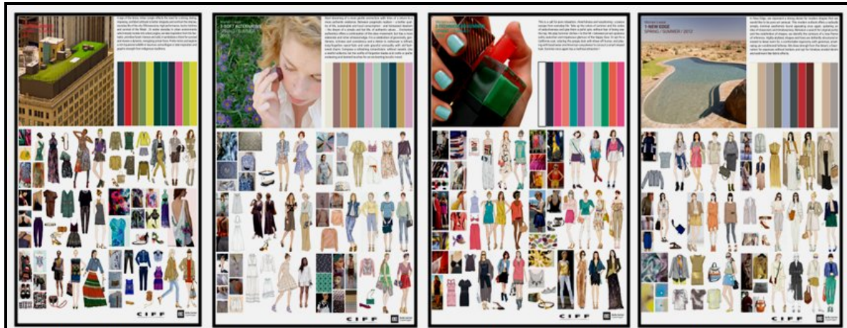
صورة (8) موضوعات لوحات الصيغة للأزياء بالموضة العالمية لعام 2011/2012 والمعيرة عن الملابس اليومية، والمساء والسهرة، والخارجية، والأساسية

تُعرض لوحات الصيغة للأزياء على هيئة أربعة أو خمسة موضوعات "قصص" محددة بالتنبؤات العالمية للموضة ويطلق عليها Themes forecast styles لموسم بعينه وتختصر إلي "Tfs" كما هو موضح بالصورة (9،8)، وتُعرف بأنها أربعة أو خمس موضوعات الأكثر انتشاراً للموضة العالمية والمحددة من قبل مجلس المصممين بباريس "الغرفة النقابية للحياكة الباريسية لبيوت الأزياء الراقية"، ويبرز كل موضوع على حده من موضوعات الموضة العالمية داخل لوحة "لوحة الصيغة"