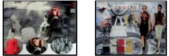
صورة (٥) لوحات الصيغة Mood boards بالطريقة التكنولوجية