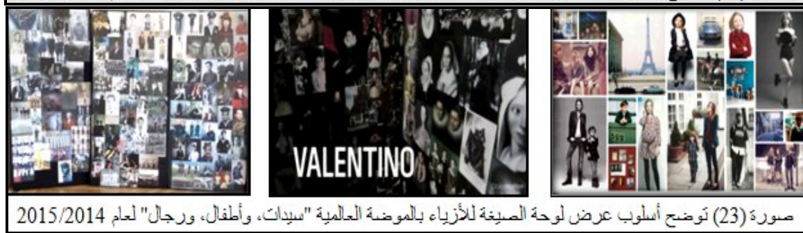
صورة (23) توضح أسلوب عرض لوحة الصيغة للأزياء بالموضة العالمية "سيدات، وأطفال، ورجال" لعام 2014/2015