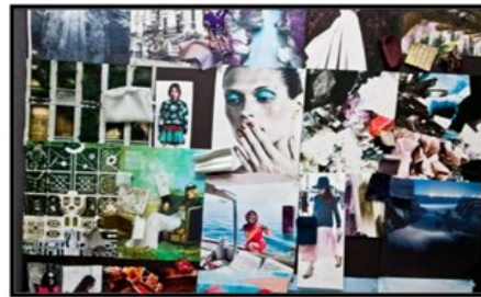
صورة (2) لوحة القصة Story board