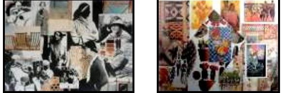
صورة (٤) لوحات الصيغة Mood boards بالطريقة التقليدية