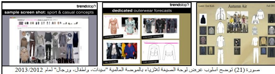
صورة (21) توضح أسلوب عرض لوحة الصيغة للأزياء بالموضة العالمية "سيدات، وأطفال، ورجال" لعام 2012/2013