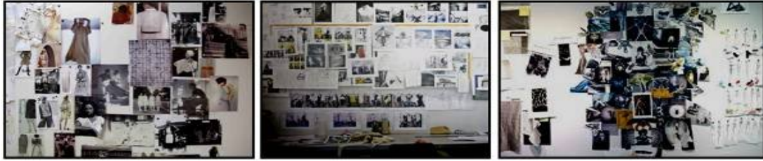
صورة (24) توضح لوحات الطراز بتنفيذ القطع الملبسيه للموسم بشركة الملابس

هي لوحة يدون فيها مصمم الأزياء المعلومات الكافية عن السوق المستهدف أو العملاء المُصمم من أجلهم ومنها "مستوى الطبقة الاجتماعية، والمدى العمري، ونوع الجنس، وأسلوب المعيشة، والموقع الجغرافي، وعادات الأنفاق، وقيمة الدخل". ومن ثم توضع مواصفات التصميم لكل قطعة ملبسيه على حده. (Brown: 2010-162)