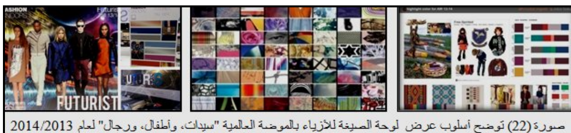
صورة (22) توضح أسلوب عرض لوحة الصيغة للأزياء بالموضة العالمية "سيدات، وأطفال، ورجال" لعام 2013/2014