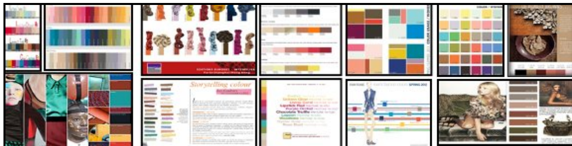
صورة (15) لوحات الألوان colors board للأزياء بالموضة العالمية