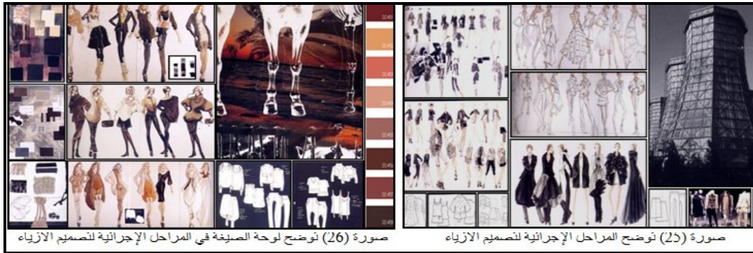
صورة (26) توضح لوحة الصيغة في المراحل الإجرائية لتصميم الأزياء