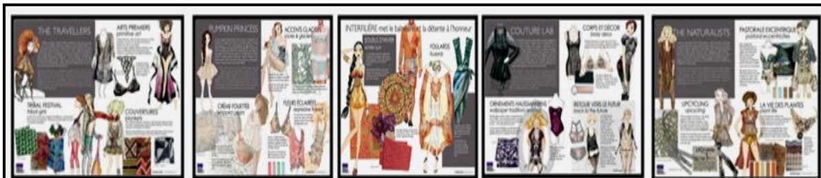
صورة (9) موضوعات لوحات الصيغة للأزياء بالموضة العالمية لعام 2012/2013 والمعيرة عن الملابس اليومية، والمساء والسهرة، والخارجية، والأساسية