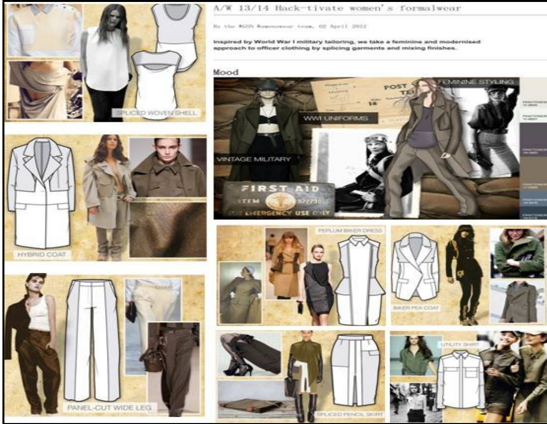
صورة (٦) محتويات لوحة الصيغة Mood boards لعام ٢٠١٤ للأزياء بالموضة العالمية بأشكالها الظلية، وخاماتها، وألوانها، وتفاصيلها

مليسيه متنافسة عن غيرها بالموضة العالمية، وتحدد بعناية تفاصيل الملابس للطرازات المتنوعة لتلائم كافة الدول والبلدان المستوردة لتفاصيل تلك الموضة العالمية. وتؤكد التفاصيل وقصاتها على طبيعة وخصائص المستهلك ومنها "الشخصية، والشكل، وطبيعة الجسم، والسن، والمقاس، والحالة الاجتماعية" لتبرز التوافق المطلوب للمظهر الجيد. وتبرز لوحة الصيغة تنوع التفاصيل والقصات الجديدة للأزياء بالموضة العالمية بشكل واضح كما هو موضح بالصورة (٦)، والتي تختلف من عام