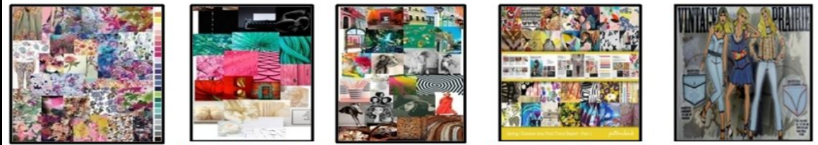
صورة (7) لوحة الصيغة Mood board للأزياء بالموضة العالمية والخاصة بالتقنيات الزخرفية

التقوية والحياكة الملائم لطبيعة القطع الملبسيه التي تنتجها الشركة، والسوق المستهدف، ومتطلبات المستهلك الذي يصمم من أجله في ضوء إمكاناتها، وذلك نظراً لتأثير تلك التقنيات في الأداء الوظيفي للملابس ومستوي الجودة الكلي والنهائي للقطع الملبسيه التي تنتجها الشركة. وتوضع تقنيات الحياكة بلوحة