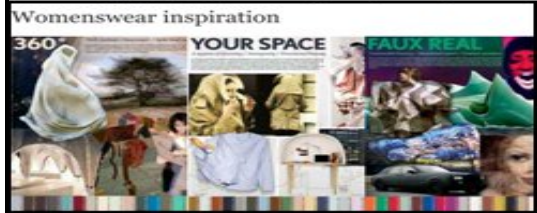
صورة (14) توضح صور الشخصيات القريبة لمصدر الاستلهام والطراز والألوان والاقفاص والطراز والالوان والخامات المستلهم منها لوحة الصبغة والخاصة بتزياء السيدات لشتاء عام 2011/2012