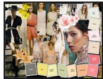
صورة (1) لوحة الصيغة Mood board