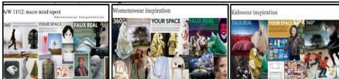
صورة (18) توضح أسلوب عرض لوحة الصيغة للأزياء بالمووضة العالمية "سيدات، وأطفال، ورجال" لعام ٢٠١٢/٢٠١١